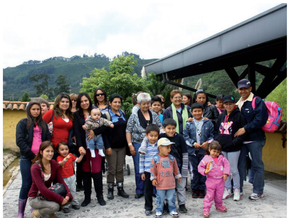
■ Celebración del “Día del niño” en 2011.

En este encuentro se les brindará a los pequeños un espacio de recreación y diversión en este mes dedicado a ellos.