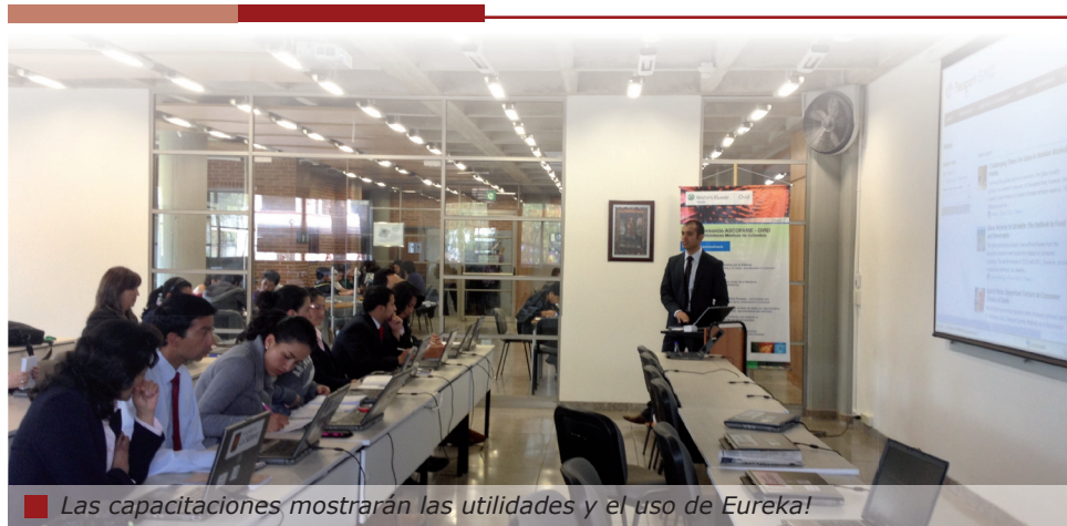
Las capacitaciones mostrarán las utilidades y el uso de Eureka!

Confirmar asistencia a: sandra.zambrano@unisabana.edu.co