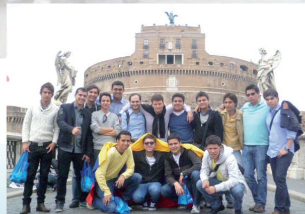
■ Trece estudiantes participaron en 45° Congreso Internacional Universitario UNIV 2012 en Roma.