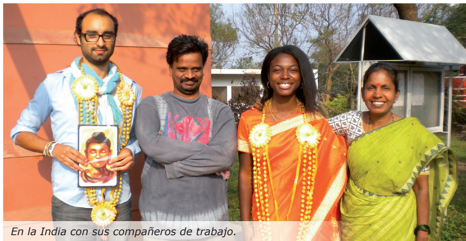
En la India con sus compañeros de trabajo.

En 2006, recibió el premio al mejor proyecto de investigación, de la Pontificia Universidad Católica de Brasil -PUC-RS, donde obtuvo un Certificado Especial de Investigación y Mejoramiento del Derecho Económico. Dos años más tarde, hizo una Maestría en Derecho Económico Internacional, en la Universidad Federal de Rio Grande do Sul - UFRGS.