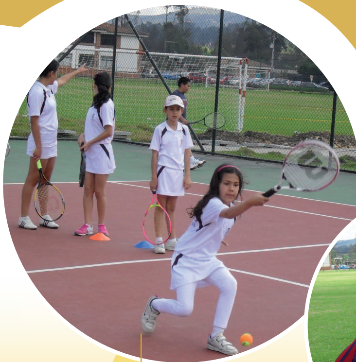
Participante de tenis de Campo.