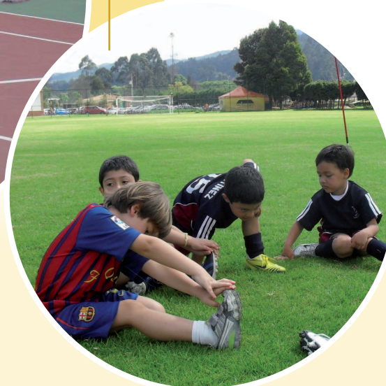
Durante el estiramiento.