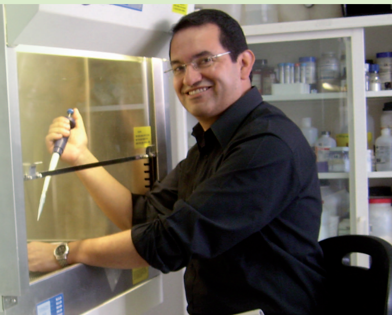
■ José Manuel Lozano Moreno.

El Dr. José Manuel Lozano Moreno, el científico colombiano más referenciado en publicaciones de difusión internacional, con unas mil citas bibliográficas y 43 artículos publicados en revistas de alto factor de impacto, visitará el Campus de la Universidad de La Sabana.