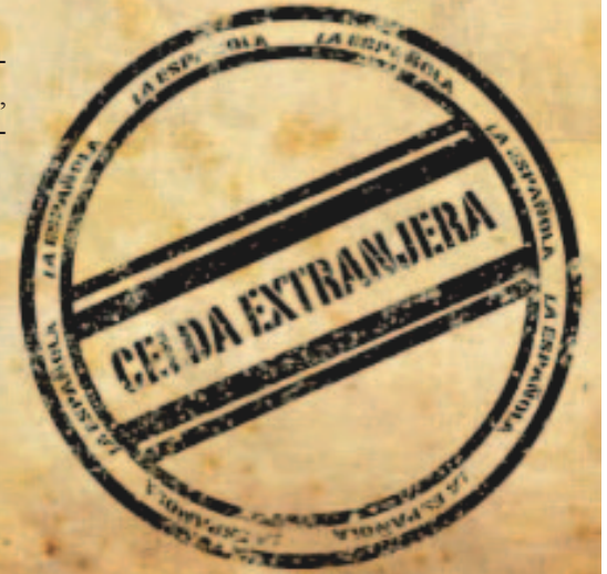
■ Imagen oficial documental "Celda Extranjera".

Celda Extranjera , emitido en el programa "Cine Capital" del Canal Capital, fue escrito, dirigido y producido por Luisa Fernanda Vallejo, quien además contó con el apoyo de otros estudiantes del programa como Carlos Daniel Jiménez y Manuel Velásquez.