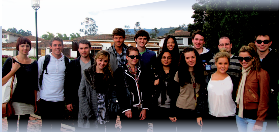
■ Participantes del Latin American Studies Program 2012-1, provenientes de Australia y Estados Unidos.

La Dirección de Relaciones Internacionales envía un cordial saludo de bienvenida a los 16 participantes del "Latin American Studies Program (LASP)", organizado por la Jefatura de Movilidad y Recursos Internacionales, provenientes de University of Queensland, Queensland University