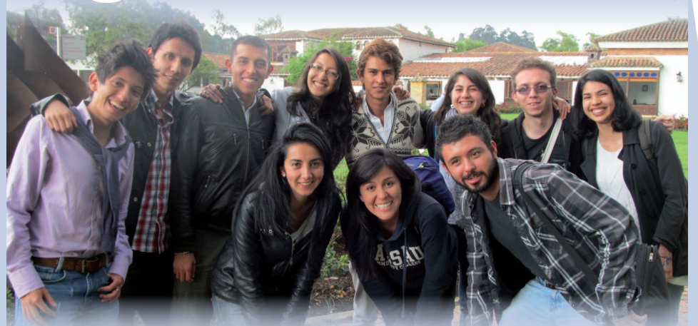
■ Estudiantes de La Sabana que acompañarán a los participantes del LASP, como parte del Buddy Program, mediante el cual apadrinan a estudiantes internacionales.

Durante cuatro semanas los participantes tomarán cursos sobre Derecho, Negocios, Cultura y Comunicación Latinoamericana, dictados en inglés por pro-