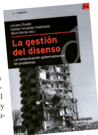
■ Carátula del libro “La Gestión del disenso. La comunicación gubernamental en problemas”.

Esta publicación también cuenta con el trabajo de autores de otros países como Argentina, Uruguay, México y España, casi todos provenientes de la academia y la consultoría. Ellos aportan con sus artículos, contenidos al mundo académico y profesional de la comunicación.