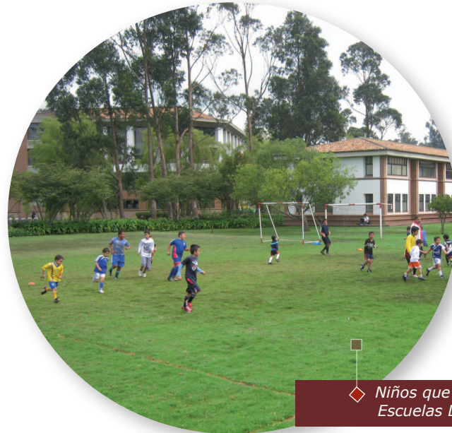
◆ Niños que hicieron parte de las Escuelas Deportivas de Fútbol.

El pago podrá hacerse en efectivo mediante descuento por nómina.