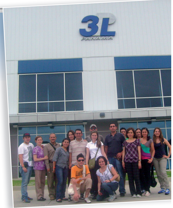
Grupo de estudiantes de las especializaciones de Gerencia de Producción y Operaciones y Gerencia Logística, en su visita al Operador Logístico 3PL en Panamá.