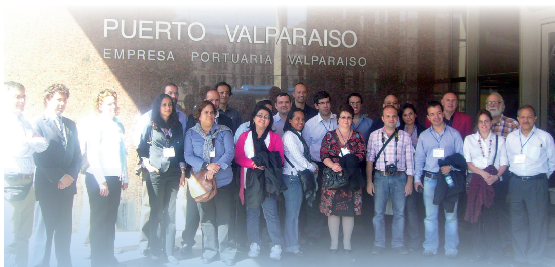
Representantes de las 15 universidades latinoamericanas reunidas en Viña del Mar para el Comité de Dirección del Centro Latinoamericano de Innovación en Logística.