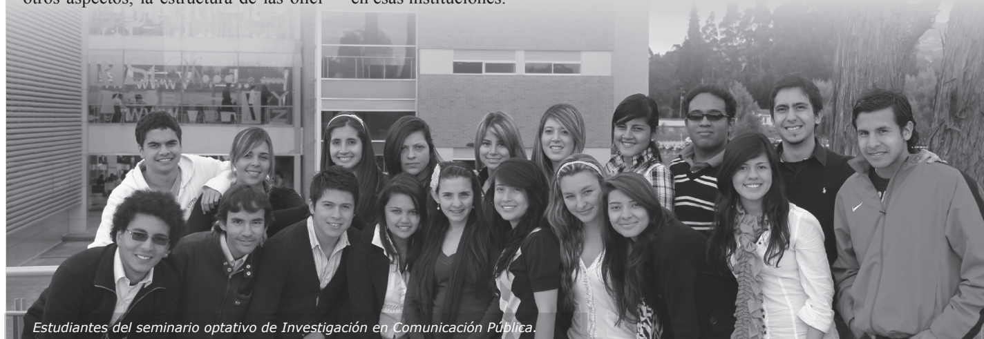
Estudiantes del seminario optativo de Investigación en Comunicación Pública.

Se tiene previsto que esta actividad se mantenga el próximo semestre. En el 2012-1 los estudiantes que se inscriban al seminario auditarían varios ministerios, entre ellos las carteras de Defensa, Interior y Cultura.