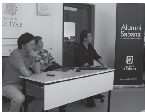
Graduados emprendedores contando su experiencia de montar empresa.

Alumni Sabana y el Centro de Emprendimiento e Innovación Sabana realizaron el Foro Emprendedores Exitosos, al que invitaron como ponentes a tres graduados de diferentes programas académicos de la Universidad.