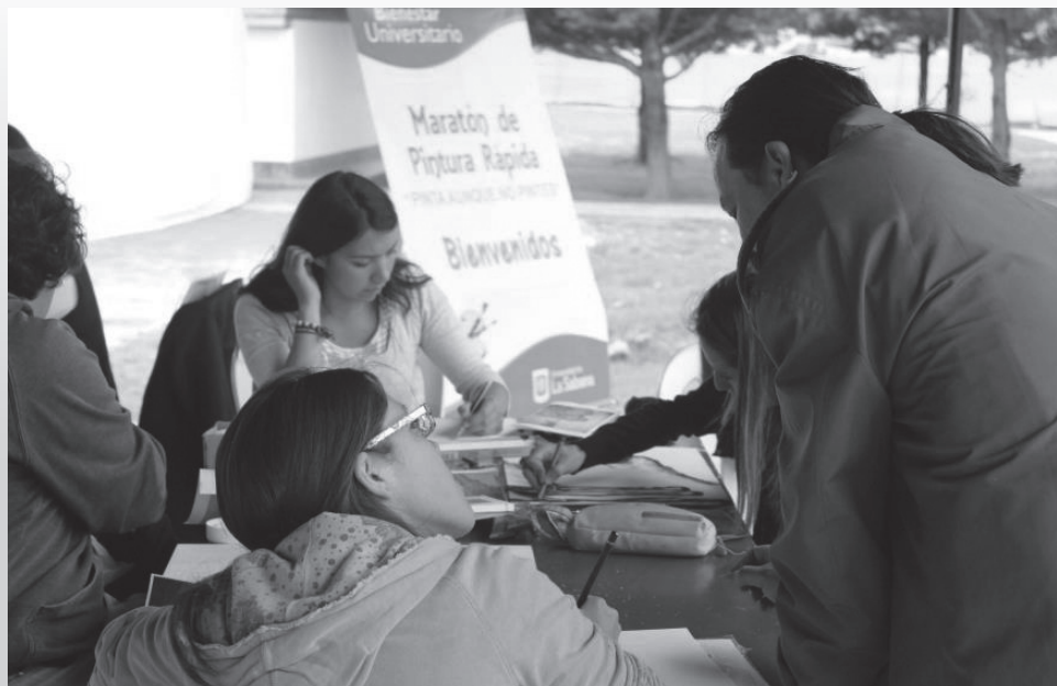
Las técnicas implementadas fueron óleo, acuarela y acrílico.

Los ganadores recibieron una placa conmemorativa y un reconocimiento monetario. La pintura que ganó el primer puesto será enmarcada y exhibida en el Edificio O (Jefatura de Desarrollo Cultural).