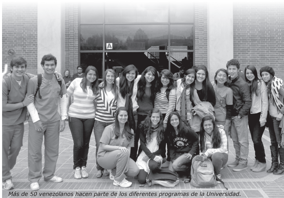
Más de 50 venezolanos hacen parte de los diferentes programas de la Universidad.

Su número, que ya supera el medio centenar, en especial en la Facultad de Medicina, ha promovido que ya se hayan celebrado tres “Encuentros de Estudiantes Venezolanos” en La Sabana; ellos, por su parte, manifiestan sentimientos de gratitud por la acogida que han recibido por parte de la Universidad ya que al estar lejos de su patria La Sabana se ha constituido en su segundo hogar.