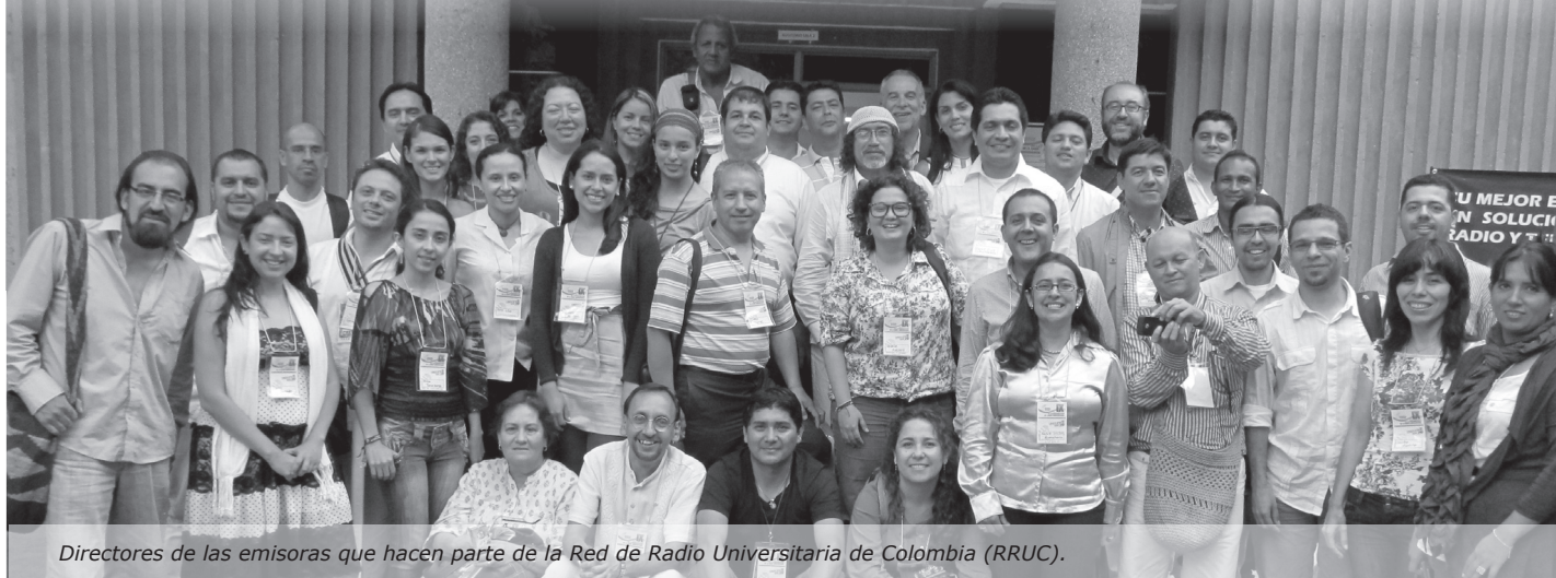
Directores de las emisoras que hacen parte de la Red de Radio Universitaria de Colombia (RRUC).

En la Universidad de Sucre (Sincelejo), se llevó a cabo el IX Encuentro de la Red de Radio Universitaria de Colombia (RRUC) que contó con la participación de los directores de 46 emisoras que hacen parte de 35 universidades colombianas.