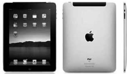
Ipad 32 GB / WIFI+3G