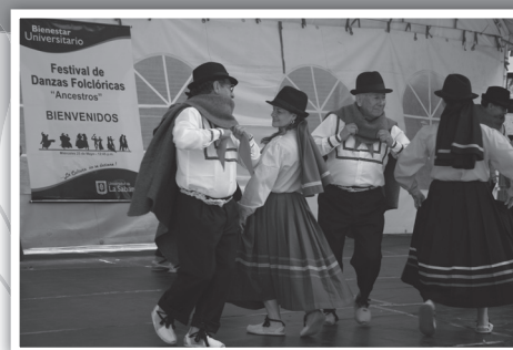
Uno de los grupos participantes en el Festival de Danzas Ancestros

La Universidad de La Sabana fue la anfitriona en la Sede Arrayanes. Al finalizar el evento se entregó un reconocimiento de participación y agradecimiento a cada grupo.