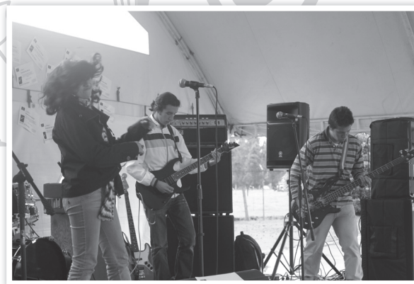
Los estudiantes inscritos hicieron su presentación en el I Festival de Rock