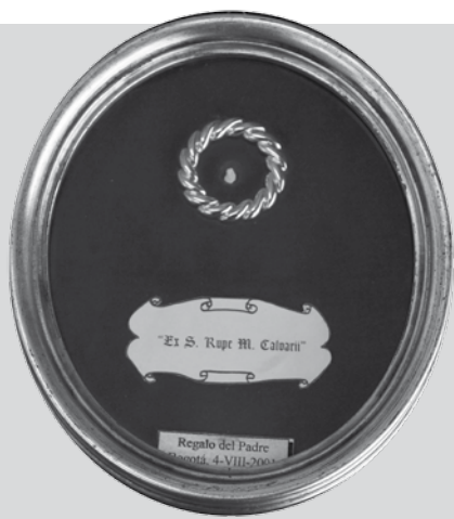
En el interior del marco se encuentra el pequeño fragmento de roca del Monte del Calvario.