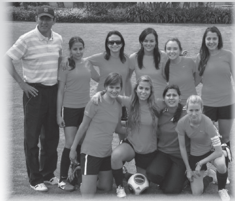
Orange Girls, equipo de graduadas de la Facultad de Comunicación.