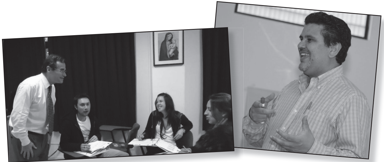
Conferencistas internacionales en la Escuela de Verano 2011.

Entre los conferencistas de la Escuela Internacional de Verano que se realizará de junio 3 a julio 2 en el Hotel la Fontana, se encuentran ocho profesionales de distintos países.