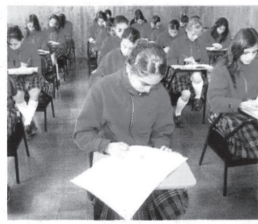
Las maestras no cuentan con suficiente preparación en pedagogía, lo cual les impide transmitir de forma adecuada su conocimiento.