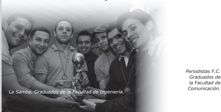
La Samba. Graduados de la Facultad de Ingeniería.

Para ver la galería de imágenes ingrese al página web de Alumni - Multimedia - Galería de Imágenes.