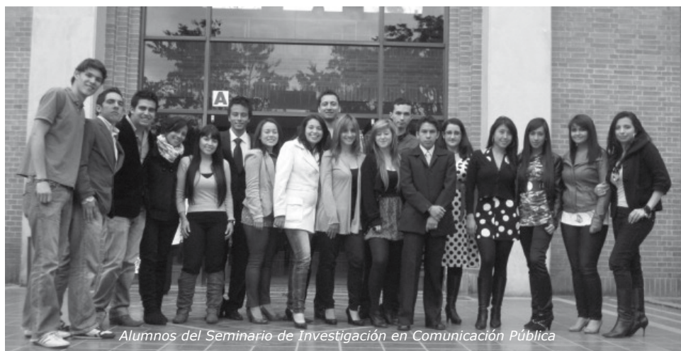
Alumnos del Seminario de Investigación en Comunicación Pública