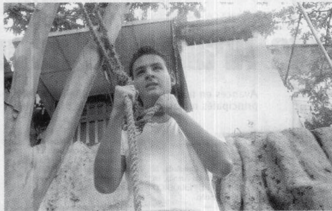
Las ideaciones suicidas son un fenómeno cada vez más común en niños y adolescentes.

Un estudio realizado en Bogotá en 482 estudiantes, afirma que uno de cada cinco manifiestan ideaciones autodestructivas.