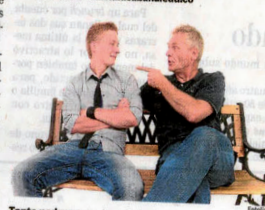
Tanto padres como hijos deben hablar con confianza.