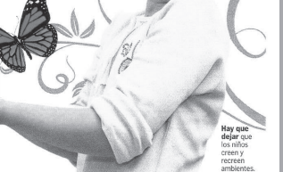
Hay que valorar los primeros 'garabatos' que los niños crean y recrean en sus cuadernos.