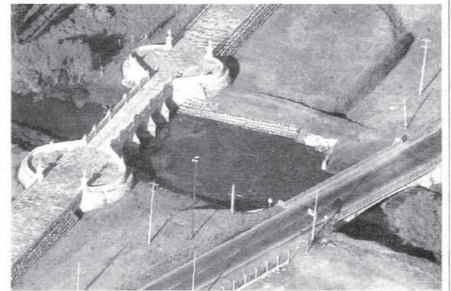
LAS OBRAS con las que se busca ampliar la vía Puente del Común - Centro Chía, iniciarán este martes.

LA AMPLIACIÓN a tres carriles de la vía Puente del Común-Centro Chía, con la que se busca agilizar el flujo vehicular hacia la región Sabana Centro, comenzarán