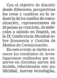
Tecnología y negocio alrededor de los medios.

Con el objetivo de discutir desde diferentes perspectivas los retos y cambios en la industria de los medios de comunicación, representantes de 29 países se reunirán, de miércoles a sábado en Bogotá, en la IX Conferencia Mundial sobre Economía y Gestión de Medios de Comunicación.