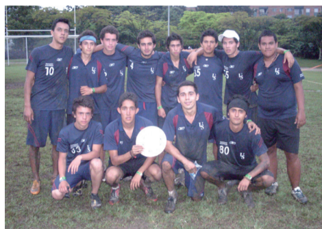
El equipo masculino de Ultimate de La Sabana se ubicó segundo en el Torneo Internacional de Ultimate Universitario - EAFIT 49 años.

Tras un comienzo de tensión, cansancio y desconcentración, la selección masculina de Ultimate de La Sabana acortó un déficit de 1-6 en contra y dio un susto en la gran final del VI Torneo Internacional de Ultimate Universitario – EAFIT 49 años a la poderosa Selección Venezuela. Faltando cinco minutos el marcador llegó a estar 9-7 a favor del equipo patriota, quienes finalmente manejaron la ventaja hasta ganar 11-8.