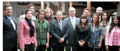
Grupo de becarios acompañados por el presidente de Terpel y las directivas de la Universidad, durante el encuentro realizado el 31 de julio en La Sabana.

Escuche la entrevista realizada al Presidente de Terpel en Actualidad al Aire , a través de www.unisabanaradio.tv hoy, lunes 3 de agosto, a las 10:00 a.m.