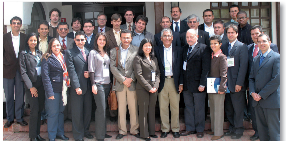
Profesores nacionales e internacionales que asistieron al Simposio