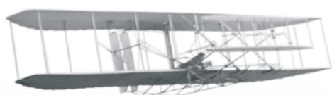
Primer vuelo con motor de la historia. Hermanos Wright, 1903.

Dejar volar la imaginación es lo que nos hace pioneros.