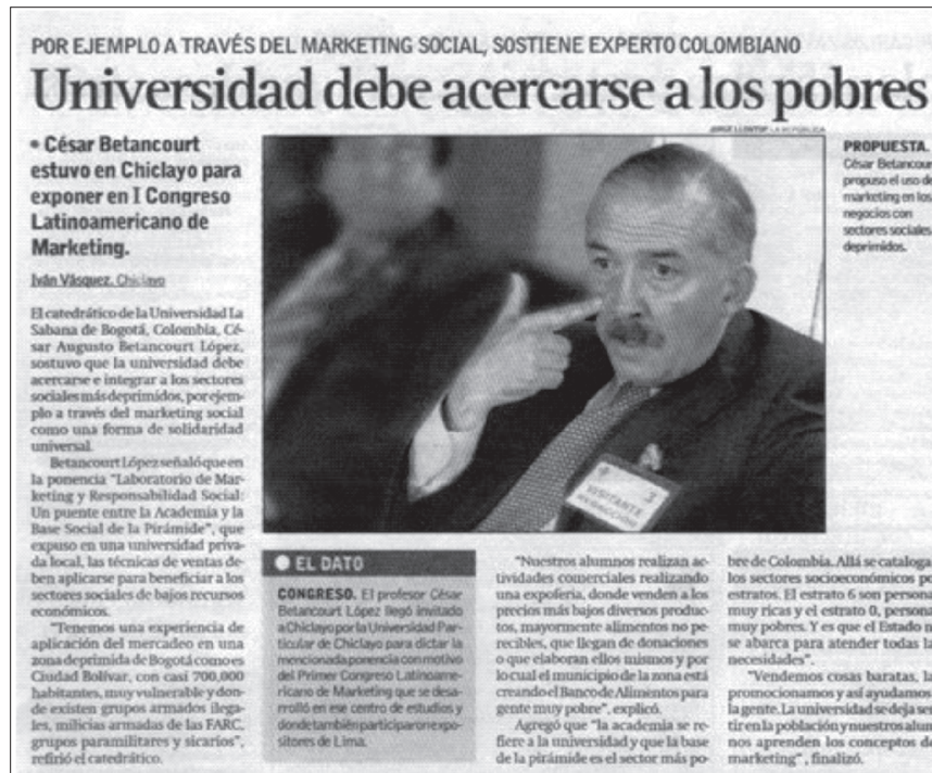
Diario La República (Perú), sábado 21 de agosto de 2008, página 21.

La gestión fue realizada en coordinación con la Dirección de Relaciones Internacionales de la Universidad, por la Jefatura de Relaciones y Prácticas Internacionales, la Decanatura y la Dirección del Programa de Mercadeo y Logística Internacional de la Escuela Internacional de Ciencias Económicas y Administrativas (EICEA).