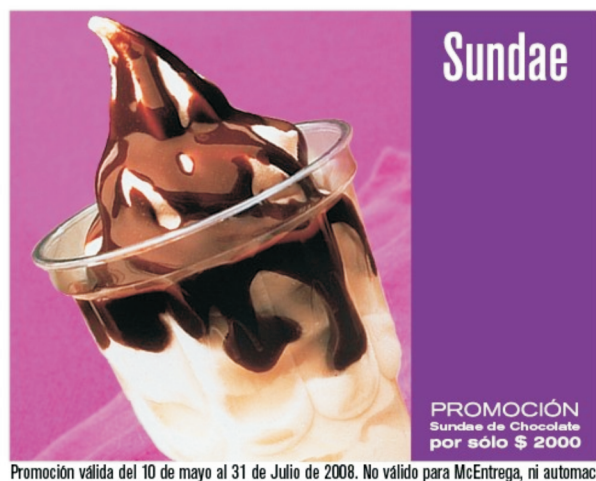
Promoción válida del 10 de mayo al 31 de Julio de 2008. No válido para McEntrega, ni automac.