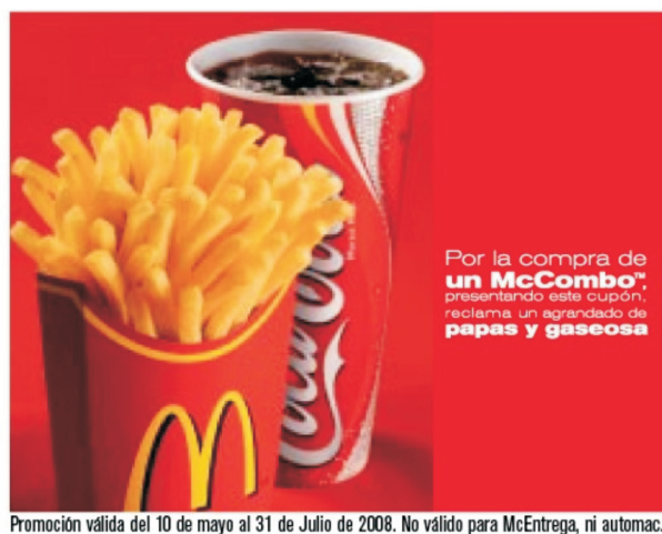
Promoción válida del 10 de mayo al 31 de Julio de 2008. No válido para McEntrega, ni automac.