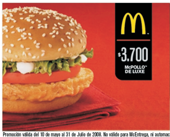
Promoción válida del 10 de mayo al 31 de Julio de 2008. No válido para McEntrega, ni automac.