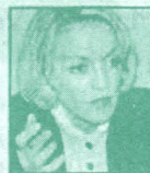
María Emma Mejía