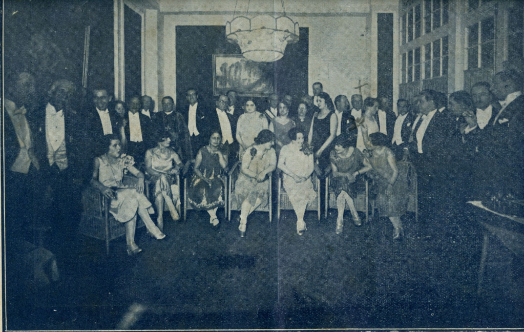
Invitados a la corrida opuida por el Sr. Ministro de Industrias en honor de los señores de petróleo.

"La solución de los problemas agrícolas no se consigue de un día a otro; pero la difusión inmediata de la labor debe servir de base para afrontar el estudio de un campo tan prometedor para esta tierra pródiga, y por eso iniciamos en tiempo la campaña, siguiendo las huellas que sabiamente se nos van trazando".