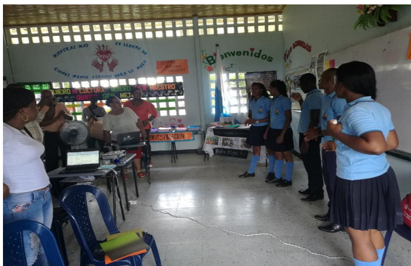
Figura 6. Docentes y estudiantes participando en la actividad No. 4

Las presentaciones se socializaron a través de un stand, donde se brindó explicación de las experiencias: