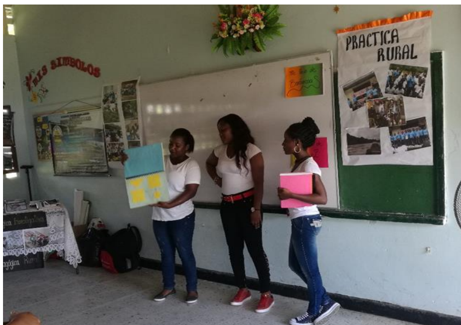
Figura 5. Foto durante la jornada de evaluación de la actividad No 3

De acuerdo al análisis del SII, la investigación en la Institución, se centra en los trabajos de grado de los estudiantes y se da línea sobre la estructura de los anteproyectos, reglamento del trabajo de grado, deberes y derechos del maestro en formación, fases del proceso de diseño, ejecución y cierre del trabajo de investigación. En este sentido, tal como se presenta, el SII está enfocado solamente al Programa de Formación complementaria, dejando de lado el interés que se tiene porque la investigación sea sistemática y transversal a todos los procesos pedagógicos y curriculares de la Institución.