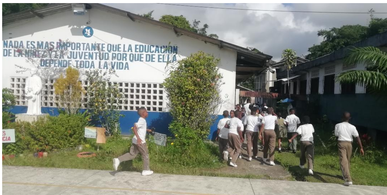
Figura 2. Foto de la Institución Educativa Normal Superior