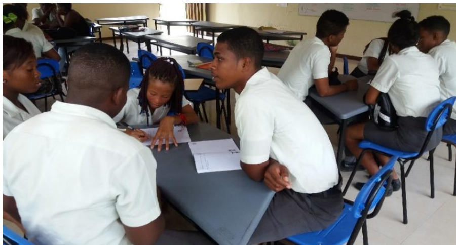
Figura 4. Foto de estudiantes participando en la actividad No. 2

En este espacio los estudiantes revisaron de manera cronológica la historia de la investigación en la Institución e identificaron algunos hallazgos, los cuales plasmaron de manera didáctica en una línea de tiempo.