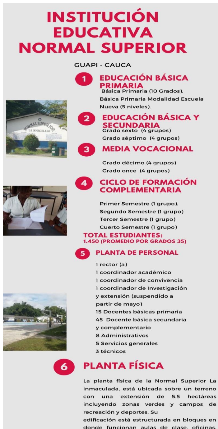
Figura 3. Infografía IE. Normal Superior