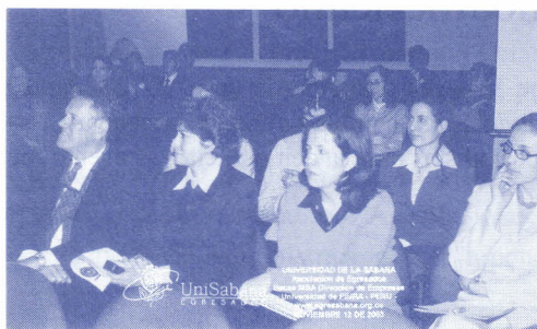
Participantes de la conferencia sobre Master en Dirección de Empresas

Treinta egresados de las Facultades de Ciencias Económicas y Administrativas, Ingeniería y Comunicación Social asistieron a una conferencia sobre el programa Master en Dirección de Empresas de la Universidad de Piura, en el Hotel 101 Park