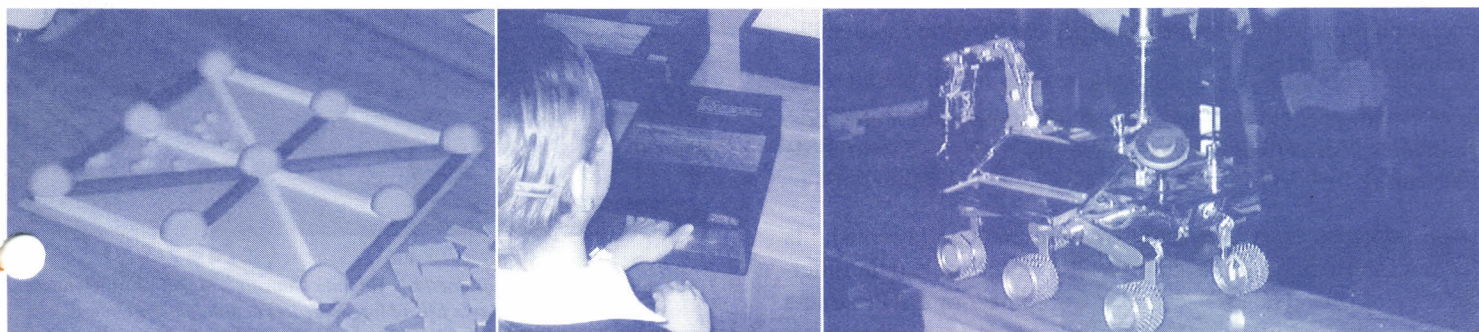
Algunos de los modelos presentados en el evento que muestran la importancia de la percepción háptica en el mundo invidente.

La Facultad de Psicología, a través de la Dirección de Laboratorios de Sensopercepción, preparó un espacio donde fueron presentadas diversas posibilidades de aprendizaje sensorial en forma de esculturas o modelos que facilitan a los invidentes la comprensión del mundo. La actividad fue denominada: Primer museo para tocar: un espacio para la estética háptica , realizada el 19 de noviembre en el Auditorio.