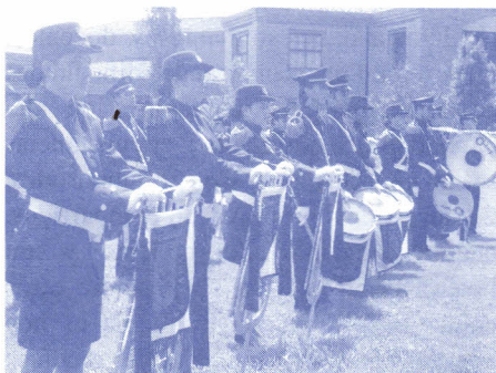
Grupo de estudiantes que hacen parte de la Banda Marcial de Paz que se inauguró el 19 de noviembre.

Un llamado a la comunidad universitaria para dejar a un lado la indiferencia e impulsar acciones pacíficas que inviten a la reflexión y al cambio de actitud frente a las dificultades que vive la nación, hizo Bienestar Universitario el pasado 19 de noviembre.