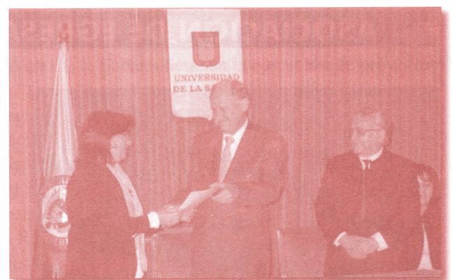
En la foto: el doctor Manuel Elkin Patarroyo recibe un reconocimiento especial por su labor científica durante muchos años.