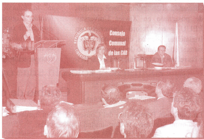
La Universidad fue sede del Consejo Comunal en el que se reunieron autoridades gubernamentales y de medio ambiente de todo el país.

Después de evaluar la gestión ambiental de las 33 Corporaciones Autónomas Regionales, CAR, de todo el país por parte del Presidente de la República, se acordó que antes de tres meses estas entidades deberán suscribir acuerdos para emprender acciones de mejoramiento de su gestión ambiental con el apoyo de las Universidades del país.