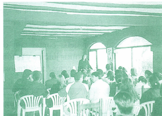
Grupo de microempresarios que recibe información sobre diversos aspectos de administración.

Como parte del desarrollo de su práctica social, los estudiantes de IX semestre de Administración de Empresas y de VII semestre de Administración de Instituciones de Servicio, han capacitado durante este semestre a más de 600 microempresarios de los municipios de Chía, Cajicá, Tocancipá, Zipaquirá, y en algunas localidades de Bogotá sobre temas relacionados con: administración general, contabilidad, mercadeo, proyectos de inversión y servicio al cliente, además de realizar 4 cursos especializados en las áreas de contabilidad y finanzas, mercadeo estratégico y proyectos de inversión. En las dos últimas semanas se han celebrado 6 clausuras en Tocancipá, Chía, la Acción Social del Ejército y el Club de Suboficiales en Bogotá, para un total aproximado de 185 empresarios graduados.