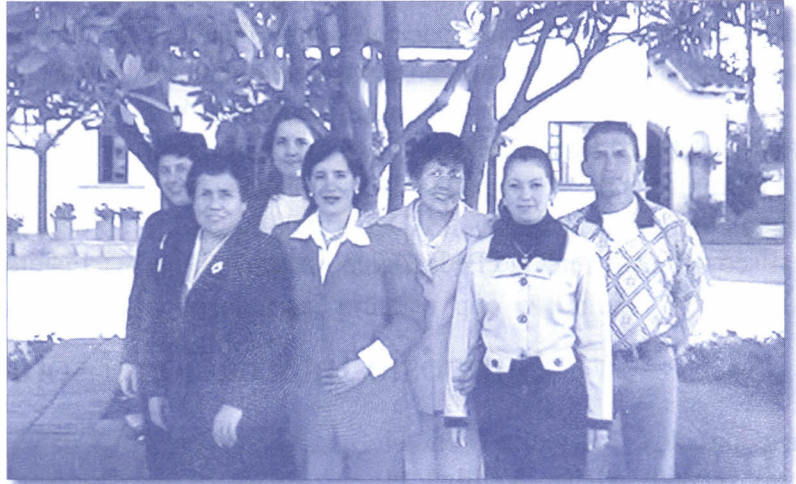
En la foto: algunas de las personas que participaron con sus ideas en el mes de septiembre.

Con gran satisfacción, el programa Gente Sabana, que premia las iniciativas de las personas que trabajan en la Universidad para mejorar los sistemas de trabajo, el servicio al cliente y aumentar el sentido de pertenencia, presentó en el primer mes de desarrollo, un total de 41 ideas aportadas por 16 personas de diferentes dependencias.