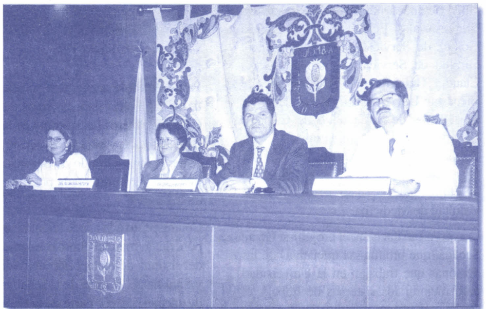
Mesa Directiva del Simposio realizado en el Auditorio David Mejía Velilla.

El evento tuvo el propósito de estrechar