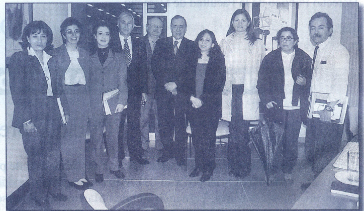
Grupo de docentes y administrativos que asistieron a la reunión sobre el mercadeo de publicaciones.

Se hizo un ejercicio con el objeto de determinar los factores que llevan a un comprador a decidirse por una publicación, teniendo en cuenta no sólo aspectos de contenido y empaque de los mismos, sino además, el servicio que se presta. Igualmente, se presentó la diferencia del concepto de creación de valor y precio de la publicación.