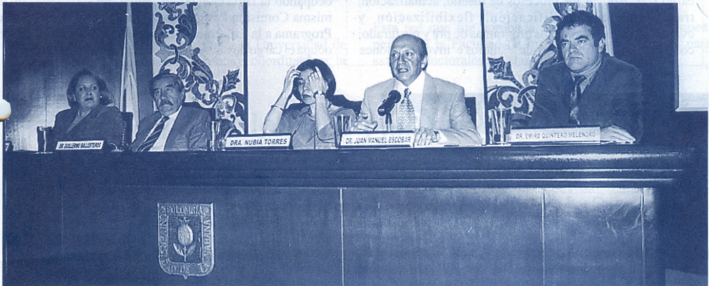
En la foto: grupo de conferencistas y directivas de la Facultad que presidieron la jornada.

La Facultad de Psicología realizó el pasado 25 de mayo en el Campus, la Primera jornada de actualización en psicoanálisis , con el fin de generar espacios de profundización, reflexión y debate frente a la situación del Psicoanálisis, a partir de sus aportes, no sólo a la Psicología, sino también a otras ciencias humanas como la sociología, la filosofía y la antropología.