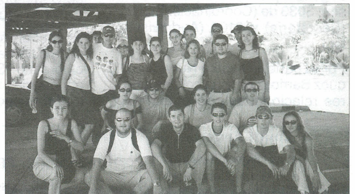
Grupo de estudiantes que participaron en esta visita.

para exportar e importar en el país. Dicha actividad fue coordinada por el Área de Mercadeo y Comercio Internacional de la Facultad.