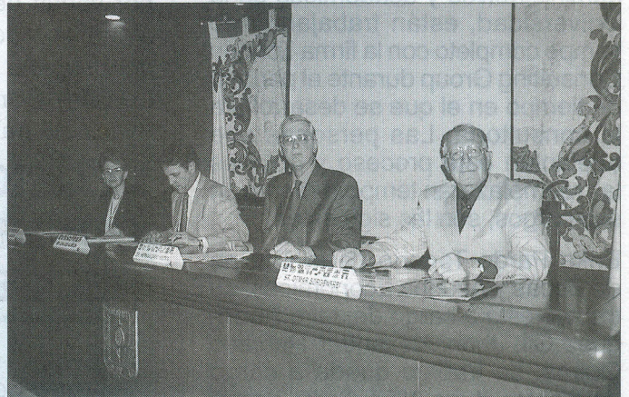
Mesa directiva del seminario.

D urante la semana del 22 al 26 de octubre, el programa de Administración de Instituciones de Servicio, de la Facultad de Ciencias Económicas y Administrativas, realizó el Seminario Internacional tendencias actuales en el sector de la hospitalidad , el cual reunió a un grupo de directivos de las facultades de administración hotelera y de varias carreras afines, provenientes de diferentes países de América Latina. Este evento se llevó a cabo con el apoyo y patrocinio de la Fundación Nestlé Pro Gastronomía y la Fundación Limmat de Suiza.