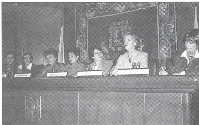
Este conversatorio tuvo como objetivo motivar el liderazgo profesional de los estudiantes.