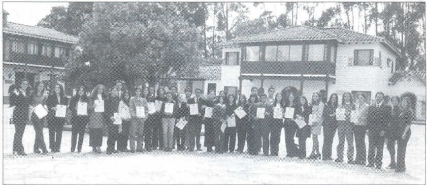
Grupo de alumnos destacados.