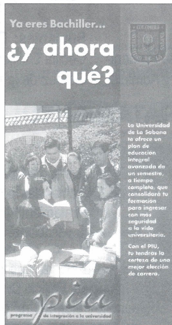
El PIU: una nueva opción para los bachilleres.

PIU es un programa de un semestre de duración, que busca consolidar la formación de los jóvenes para ingresar con más seguridad a la universidad y fortalecer al mismo tiempo su proyecto de vida. Así, no contempla tanto el desarro-