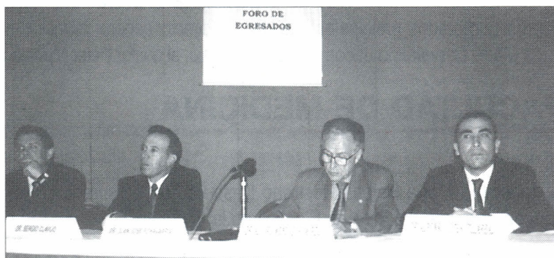
Este encuentro reunió destacados expertos en economía del país.

A propósito del debate nacional sobre los escándalos de corrupción en el país, Forum contrató a la firma Yankelovich para realizar una encuesta con 356 empresarios sobre éti-