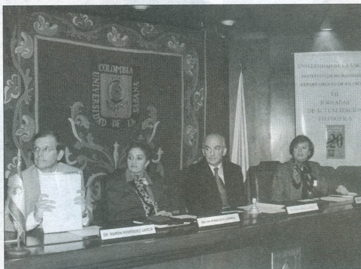
Mesa Directiva de las Jornadas de Filosofía.

E l Departamento de Filosofía del Instituto de Humanidades realizó del 1 al 3 de septiembre en el Auditorio, las VII Jornadas de Actualización Filosófica , con el desarrollo del tema: ¿Metafísica Hoy: Crítica o Reivindicación? . En éstas, a través de la presentación de distintas ponencias sobre el tema, se pretendió examinar la posibilidad o legitimidad del discurso metafísico en la actualidad, quedando la discusión abierta para desarrollos futuros.