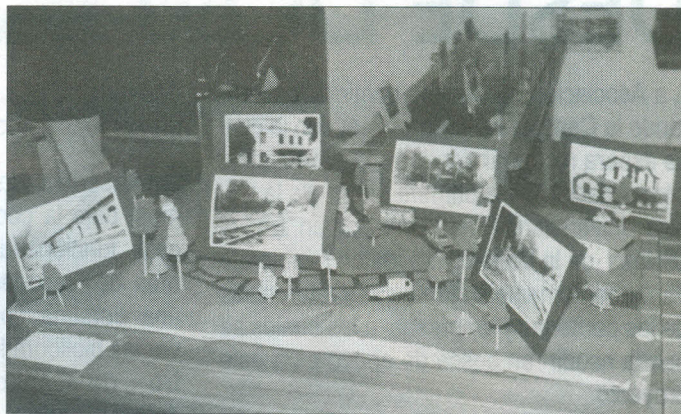
Este trabajo muestra la transformación de los conceptos en un lenguaje universal.

Con el propósito de mostrar en un lenguaje visual, las ideas y conceptos del saber científico y acercarlos a la realidad del lenguaje cotidiano, ( La teoría transformada en praxis ), un grupo de estudiantes de la materia de Teoría de la Comunicación que dirige la profesora Clara Pardo, realizaron el 30 y 31 de agosto una exposición fotográfica, en la que se representó el concepto de sistema aplicado a la información periodística como estructura, status quo, entropía, entre otros, en un esfuerzo por presentar en un lenguaje visual, el abstracto de los contenidos científicos y acercarlos a una forma clara de expresión.