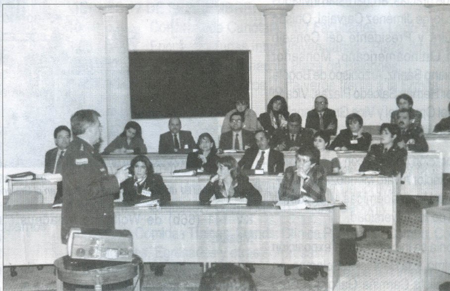
El General Rosso José Serrano Cadena, compartió la experiencia de la Policía en cinco años de cambio institucional.

D urante la semana del 23 al 27 de agosto, se desarrolló con éxito en las instalaciones del INALDE, el Foro Internacional de los Tres Sectores (Estado, Sector Privado, Sociedad Civil) , con el fin de hacer un llamado a la reflexión de estas organizaciones y generar un cambio de actitud con su participación, frente a los problemas sociales que menoscaban el desarrollo económico y político del país, teniendo en cuenta que la problemática social debe concernir a todos y por ello es vital compartir esta responsabilidad para conseguir el bienestar común.