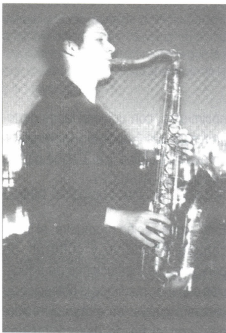
La música será una de las principales atracciones de esta Semana Cultural.

“La Palabra”, espectáculo del reconocido narrador Nicolás Buenaventura, donde una serie de relatos de tradición oral se transmiten al calor de la música compuesta e interpretada por el saxofonista Antonio Arnedo y el ex-