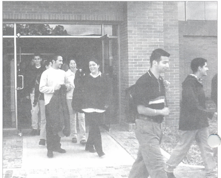
La nueva sede de la Biblioteca ofrece mejores posibilidades de estudio y consulta.