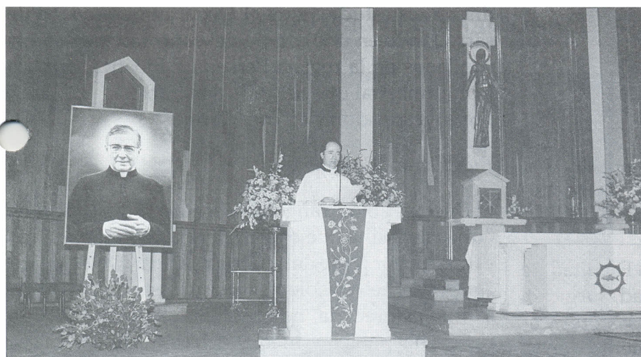
La Eucaristía fue un importante momento de unión en torno a las enseñanzas del Beato Josemaría Escrivá.