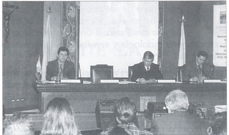
Durante el encuentro se resaltó la importancia de los medios locales en la integración de las comunidades.

Durante el evento, periodistas de distintos medios regionales, alcaldes y profesionales de otras disciplinas, plantearon la importancia de impulsar los medios de comunicación locales a partir de la