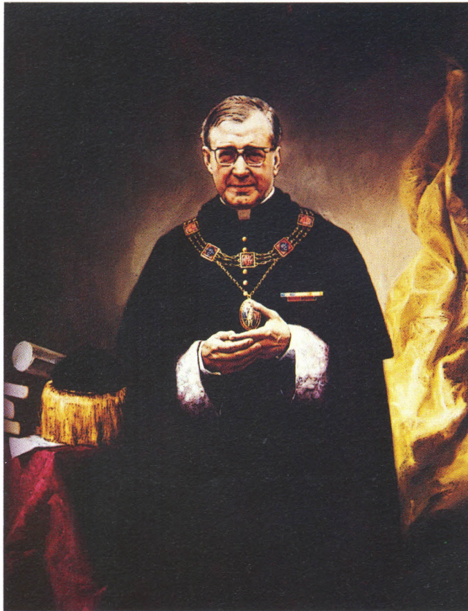
El Fundador del Opus Dei con la veste de Gran Canciller de la Universidad de Navarra.