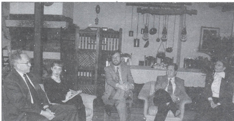
La comunicación fue el elemento central del primer Café con el Rector

Una excelente idea como canal de comunicación entre la Rectoría y la comunidad universitaria". Este fue quizá uno de los puntos de mayor consenso durante el primer Café con el Rector , que se llevó a cabo el pasado 27 de agosto en la Casa de Gobierno de la Universidad.