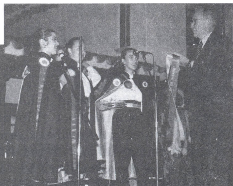
Imágenes de la fiesta de la Universidad, organizada en septiembre del año pasado