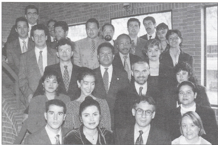
Profesionales de varios países integran este Doctorado

C on 26 participantes de Venezuela, México, Ecuador, Bolivia, España y Colombia, se dio inicio al Doctorado en Derecho Tributario.