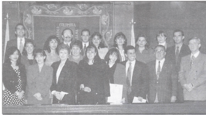
Grupo del Curso de Gerencia, con docentes y directivos del Programa

E l Programa de Fomento y Desarrollo Empresarial, MICROSABANA, llevó a cabo en el Auditorio de la Universidad, la clausura del Curso de Gerencia para Pequeñas Empresas dictado en el Barrio Prado Veraniego.