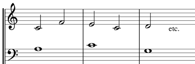
Figura 2. Contrapunto, ‘segunda especie’. Las notas del discantus duran la mitad que las del cantus firmus . En este ejemplo, contra cada redonda del cantus firmus se escriben dos blancas en el discantus .

en el de segunda especie, por ejemplo, las notas que se ponen contra el cantus firmus tienen la mitad de la duración. Si el cantus firmus se escribe en redondas, entonces el discantus se escribirá en blancas, como se muestra en el siguiente ejemplo: