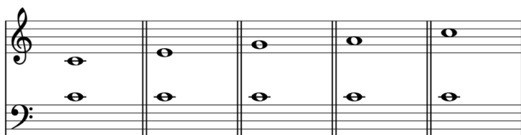
Figura 1. Contrapunto, en su forma más elemental y sencilla, ‘primera especie’.

cantus , cantus firmus , o vox principalis , se añadía o ponía otra melodía, discantus o vox organalis . Así es como lo describe Petrus dictus Palma ociosa, uno de los primeros en escribir sobre el contrapunto, 15 en uno de sus tratados: “punto contra punto, o una nota producida en instrumentos naturales contra otra nota” (como se cita en Moelants, 2014, p.18). Veamos un ejemplo para ilustrar esto, en su forma más elemental (figura 1):