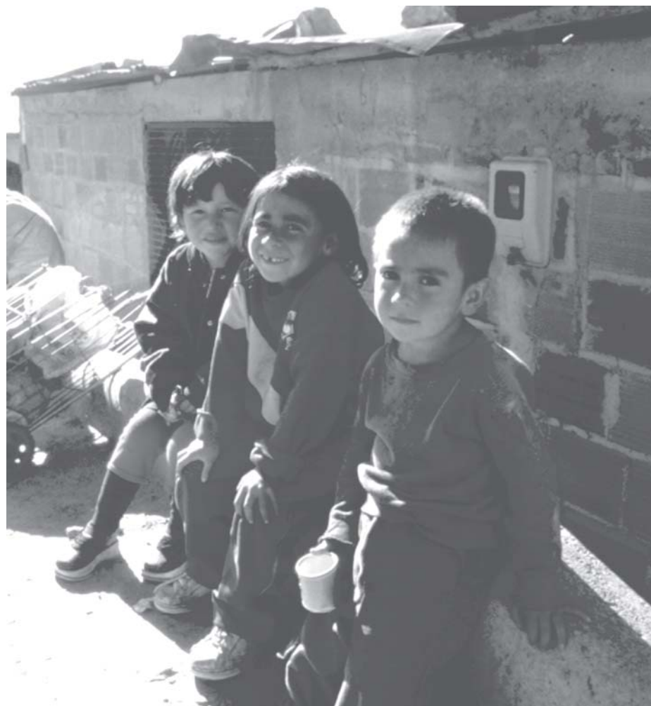
La situación en Cazucá cada día es más complicada por la presencia de grupos denominados de limpieza social, mientras otros se dedican a reclutar jóvenes para los paramilitares y autodefensas.

Escucharlos es para ellos un consuelo. Invitarlos a una gaseosa es convertirlos en millonarios (en Cazucá un almuerzo vale 500 pesos y muchas veces nadie los tiene). Contarles una historia, alejarlos de su triste realidad, tomarles una foto, los vuelve felices, quizás porque sienten que siguen existiendo.