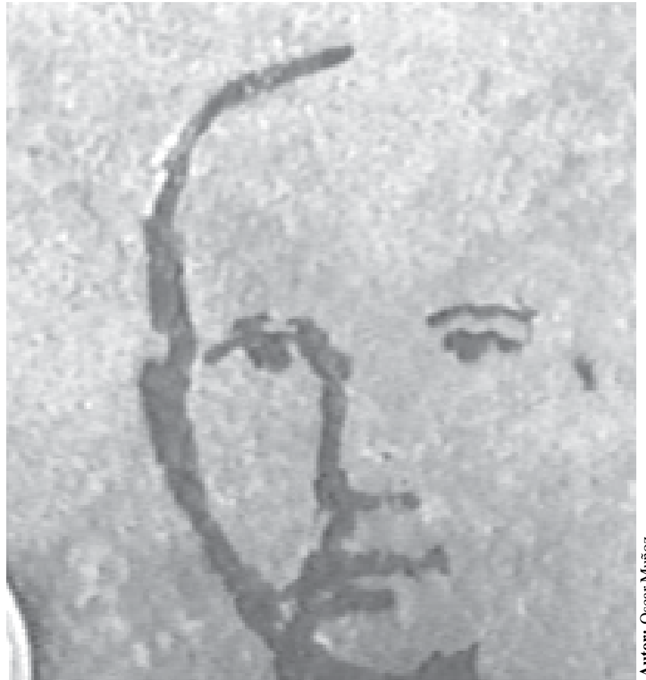
Obra: Re/Trato . Video de 28 minutos de duración, expuesto en el Museo de Arte de la Universidad Nacional.