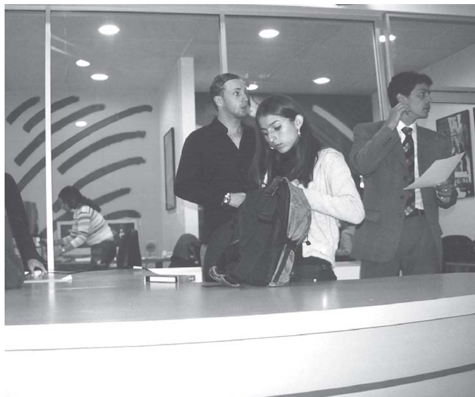
El nuevo gobierno de la Facultad tiene como prioridad poner en práctica la nueva reforma curricular, en la que los laboratorios cumplen una tarea relevante.