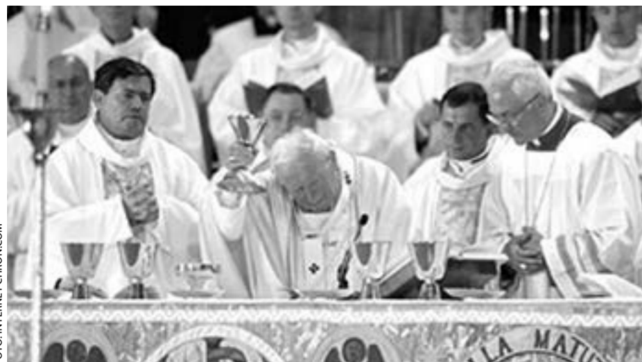
Su Santidad Juan Pablo II invitó a los padres de familia a ejercer control sobre la información que reciben los niños. Los menores, debido a su condición, ignoran la diferencia entre mensajes edificantes y nocivos, y ahí se requiere orientación.

Con respecto a ese fenómeno de la comunicación, el papa Juan Pablo II aconsejó a los padres de familia fomentar el espíritu crítico y reglamentar el uso de los medios en los hogares, que se tenga la valentía para resistir las presiones comerciales e ideológicas que promuevan una concepción inadecuada de la familia. Los padres deben planificar y programar el uso de estos medios, prohibiendo algunos de ellos, convirtiendo el entretenimiento en una experiencia familiar y dejando espacio para algunas actividades propias del hogar.