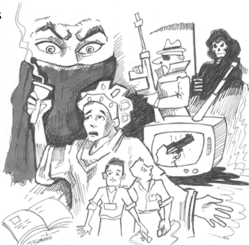
ILUSTRACIÓN: JOSÉ BERNARDO SARMIENTO

La Flip también analizó las repercusiones del gobierno de Álvaro