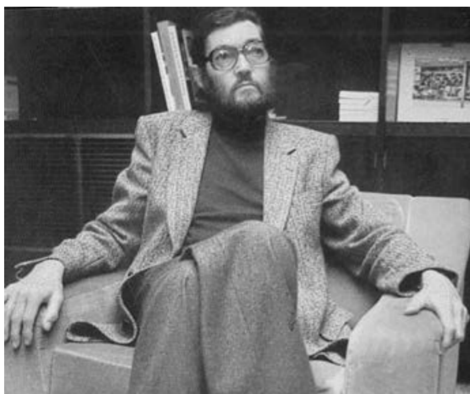
Su música: el jazz; su deporte: el boxeo; su literatura: la vida; la vida: la literatura; sus historias: más allá de famas y cronopios; rayuela, los premios.

Sin embargo, tu primer libro –de poemas– titulado Presencia, firmado con el seudónimo Julio Denis, y ahora "felizmente olvidado", solo llegaría hasta los veinticinco años, después de que te hicieras maestro de escuela, después de que te dejaras encantar por el jazz en pequeños bares bohemios y por el boxeo –deporte que nunca dejaste de exponer como arte– en el Luna Park, y después de que intentarás fallidamente irte a Europa en un buque de carga. Lo lograrías después, cuando golpeado por la victoria de Perón y por el rechazo de las editoriales de tu novela El Examen, con una beca del gobierno francés. Te autoexilias a París, exilio que después sería forzoso, pues desde que llegas a la Ciudad Luz empleas todas tus fuerzas en señalar las problemáti-