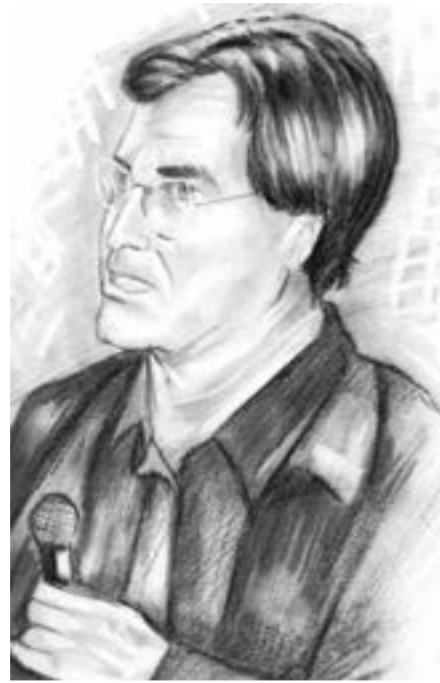
El lingüista holandés Teun Van Dijk.

Una manera efectiva de controlar las conductas ajenas—sigue el ana-