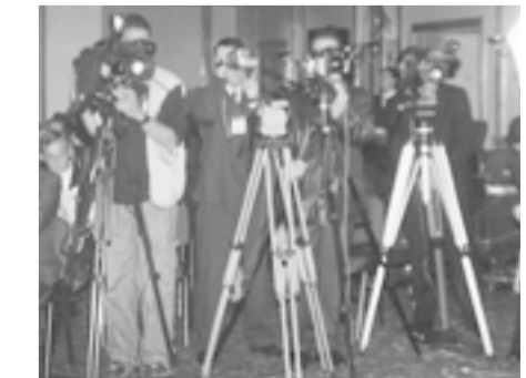
Hoy, enfocar el futuro del periodismo resulta una tarea difícil.

el periodismo, y está llamado a ser consciente de que es una pieza clave en la construcción de paz, de democracia y de país. Sin embargo, una visión extrema y errada de dicha misión puede ser contraproducente para el ejercicio de la profesión. Una cosa es informar sobre la guerra, y otra cosa es informar irresponsablemente y sin profesionalismo, sobre la guerra. En medio de un conflicto, el mejor camino para la paz no es silenciar a la prensa. Por el contrario (sin renunciar a su espíritu de ojo avizor, atento y reflexivo), debe informar y construir criterio de opinión y decisión en la sociedad.