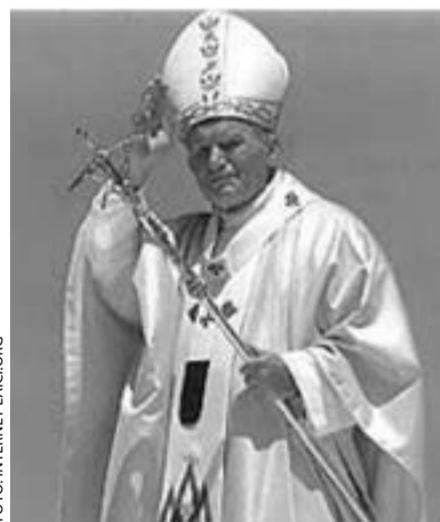
Su Santidad Juan Pablo II.

Es hora de sedimentar bases firmes para la reconstrucción moral y material