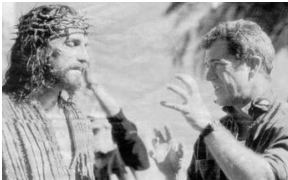
La Iglesia Católica respalda la nueva producción cinematográfica, fiel adaptación de los Evangelios, señalan los teólogos. Aquí, una de las escenas en que Mel Gibson orienta al actor James Caviezel durante el rodaje.

No hay sitio para polémicas victimarias: los espectadores somos al mismo tiempo cada uno de esos personajes y todos a la vez, viviendo este juego de miradas, a veces elusivas, a veces odiosas, a veces de sorpresa, a veces de comprensión, a veces de admiración, a veces de conversión, que responden a la mirada siempre amable, cariñosa, herida de amor, de Jesús. Como espectador, me veo empujado a averiguar cómo es la mirada de mi respuesta, mientras veo lo que sucede en la película y sobre todo luego, una vez que la historia se