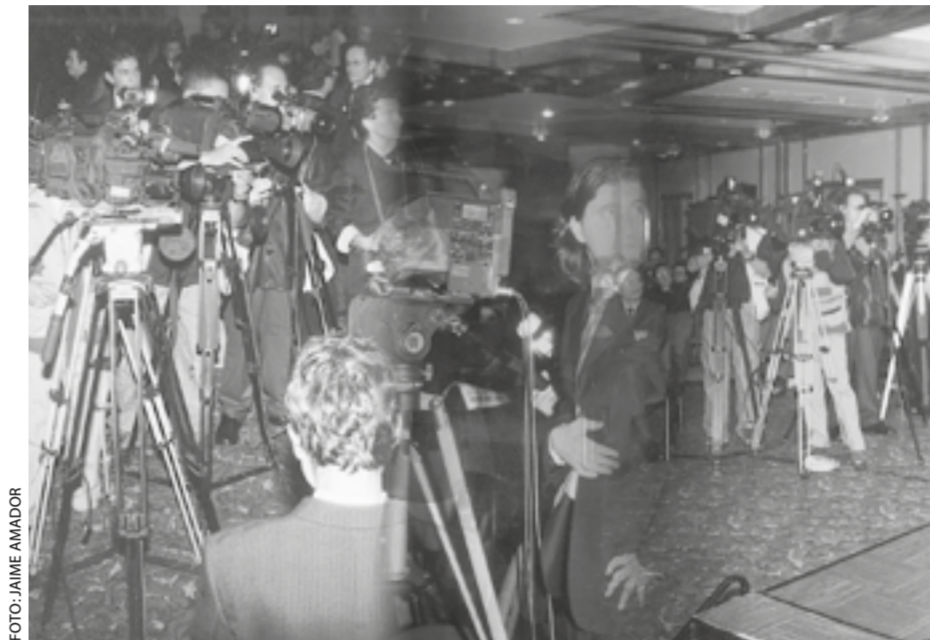
Fuerzas desconocidas pretenden ocultar, mediante la amenaza, la información que como derecho merece conocer el público en Colombia.

Las amenazas y presiones de todo tipo se cuentan entre las razones principales que impiden el libre y auténtico ejercicio de informar al público con ajuste a la verdad