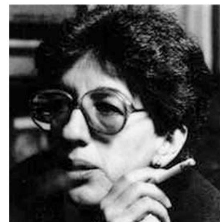
"La violencia nos ha tocado a todos de alguna manera. En mis películas se destaca mucho la estética por mis estudios de arte".

Mi contribución sería María Cano, ya que en ese momento Colombia necesitaba una película que reflejara un personaje femenino fuerte. Sin embargo, me arrepiento de no haberle puesto un poco de humor, característica que busco en mis películas; busco que la gente las disfrute y las recuerde.