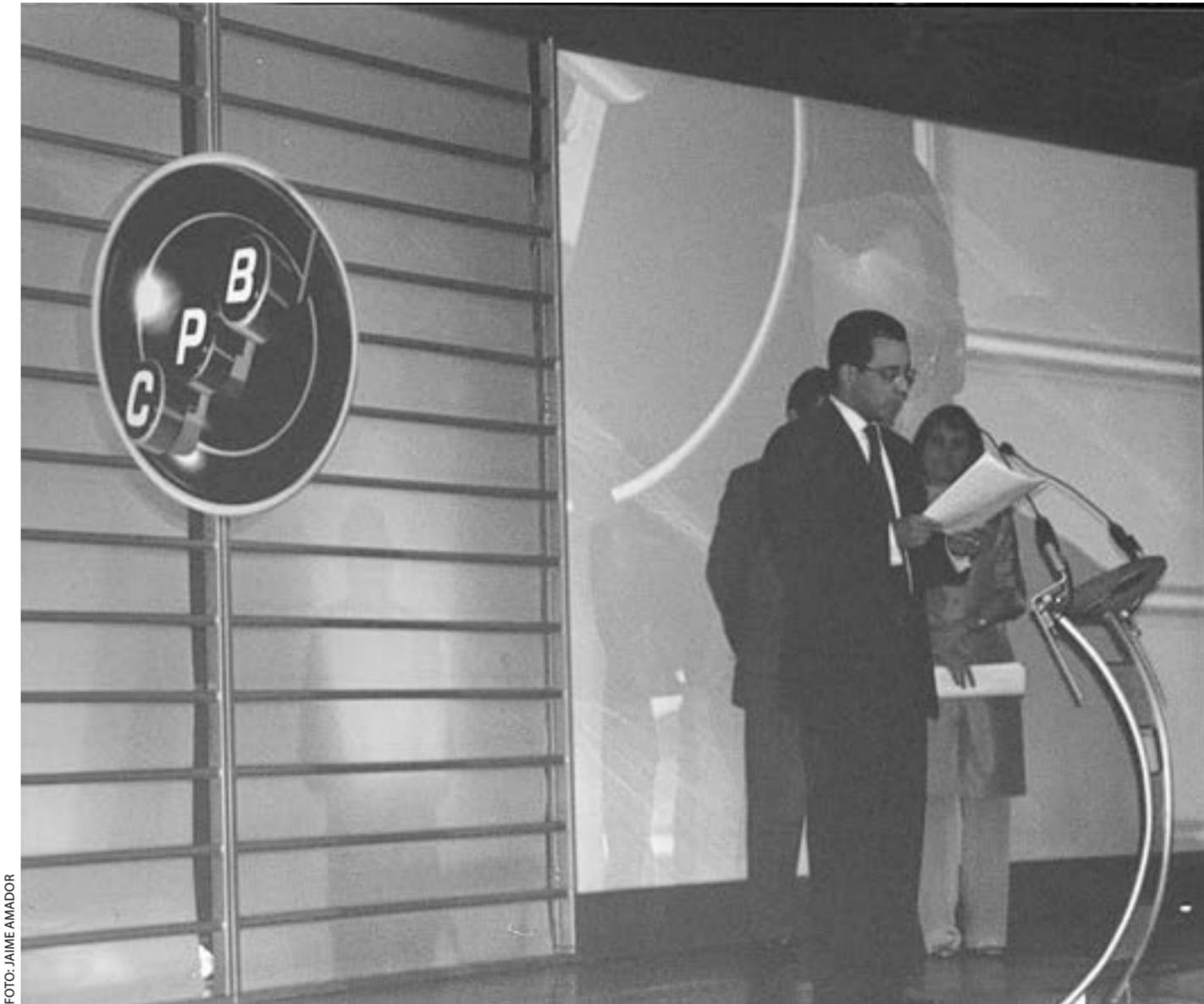
El presidente del gremio dijo que el estudio, la capacitación y la actualización resultan esenciales para sus miembros. Y destacó la importancia de ser interlocutores con los poderes del Estado. También recordó que la relación con el Gobierno ha sido un poco tensa, poco clara. Y advirtió acerca de la importancia de considerar el unanimismo: que todo el mundo termina pensando lo mismo que el Gobierno.

Por ALEJANDRA GRILLO Redactora de En directo