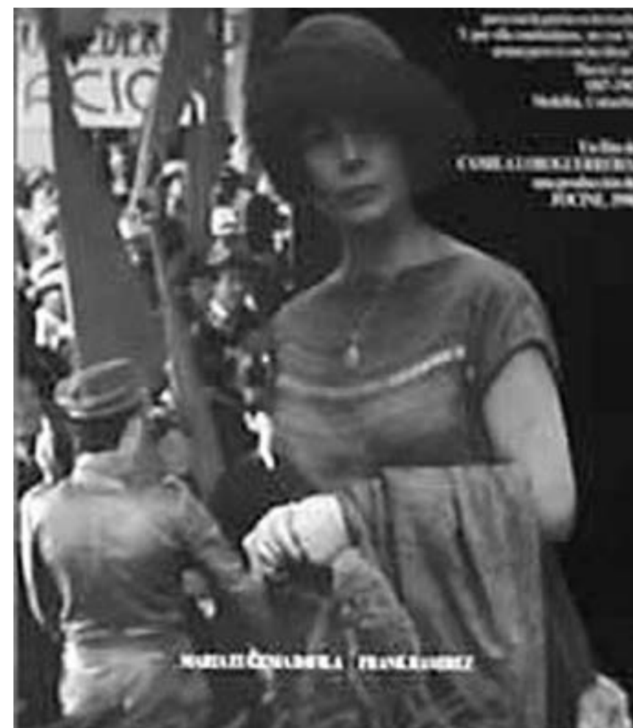
Los movimientos sociales de 1968 en Francia cambiaron su concepción del mundo. En el cine recrea sus imágenes y que tomó de la facultad de Artes de la Universidad de Los Andes.

"La gente creía que las feministas eran lesbianas con bigote que odiaban a los hombres. Creo que todas las mujeres somos feministas cuando defendemos a los personajes femeninos de nuestras películas"