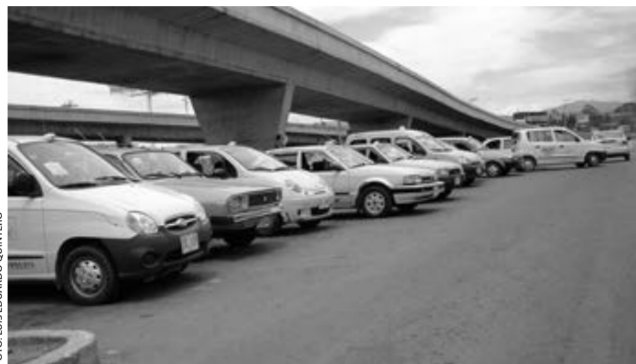
Cuántas veces al día cientos, quizás miles, de personas toman un taxi para desplazarse de un punto a otro de la ciudad sin considerar el riesgo (por el afán muchas veces) que enfrentan.

El peligro de transitar por la ciudad en un taxi junto a seres desconocidos, conductor o pasajero, aumenta en algunos sectores. La noche y el día resultan indiferentes