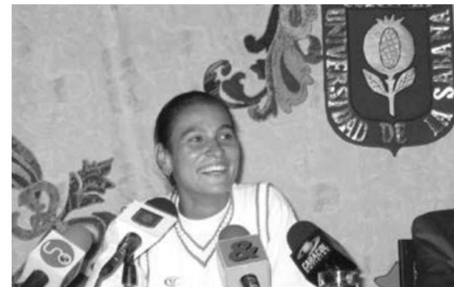
La tenista cucuteña manifestó ante la comunidad universitaria que cada día se esfuerza por mantener su calidad deportiva, reconocida en todo el mundo por los especialistas y aficionados en esta disciplina.

Las preguntas formuladas a Zuluaga en el auditorio principal de la Universidad estaban relacionadas con su