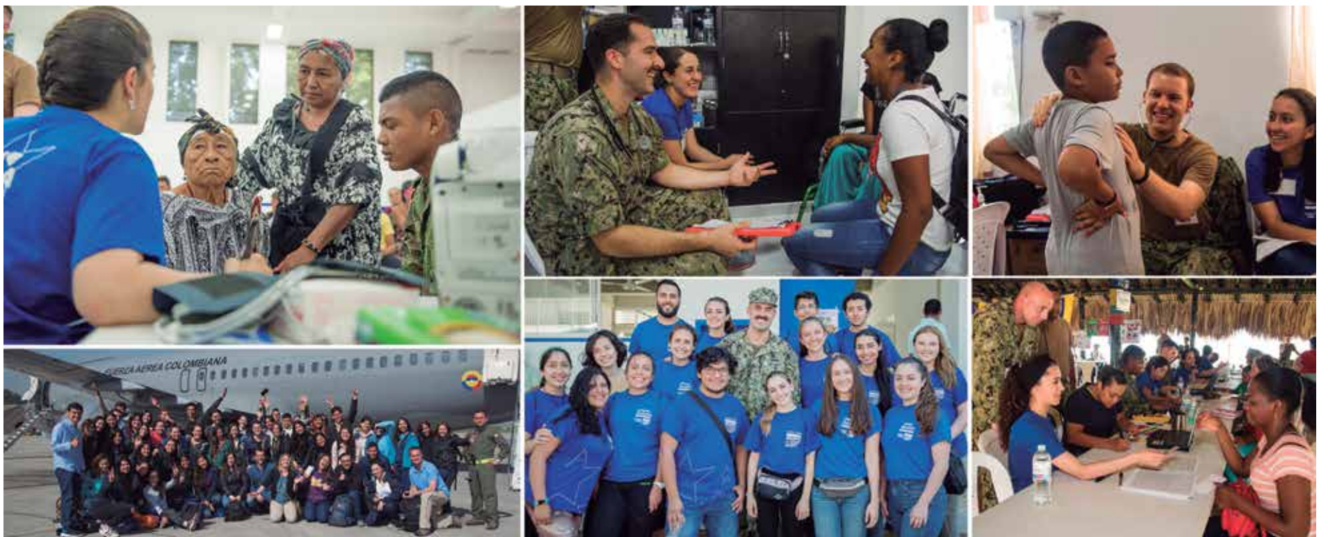
Las estudiantes se postularon a la misión para ayudar a la población vulnerable de Colombia.