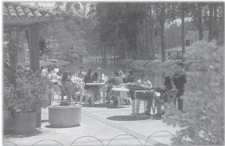
Campus Universitario Puente del Común.

Dentro de este proceso se encuentra el momento que estamos viviendo con el comienzo del milenio. Este hecho trae una serie de expectativas dentro de las cuales se encuadran esos deseos de lucha, para ser cada vez mejores. Retos para crecer como estu-