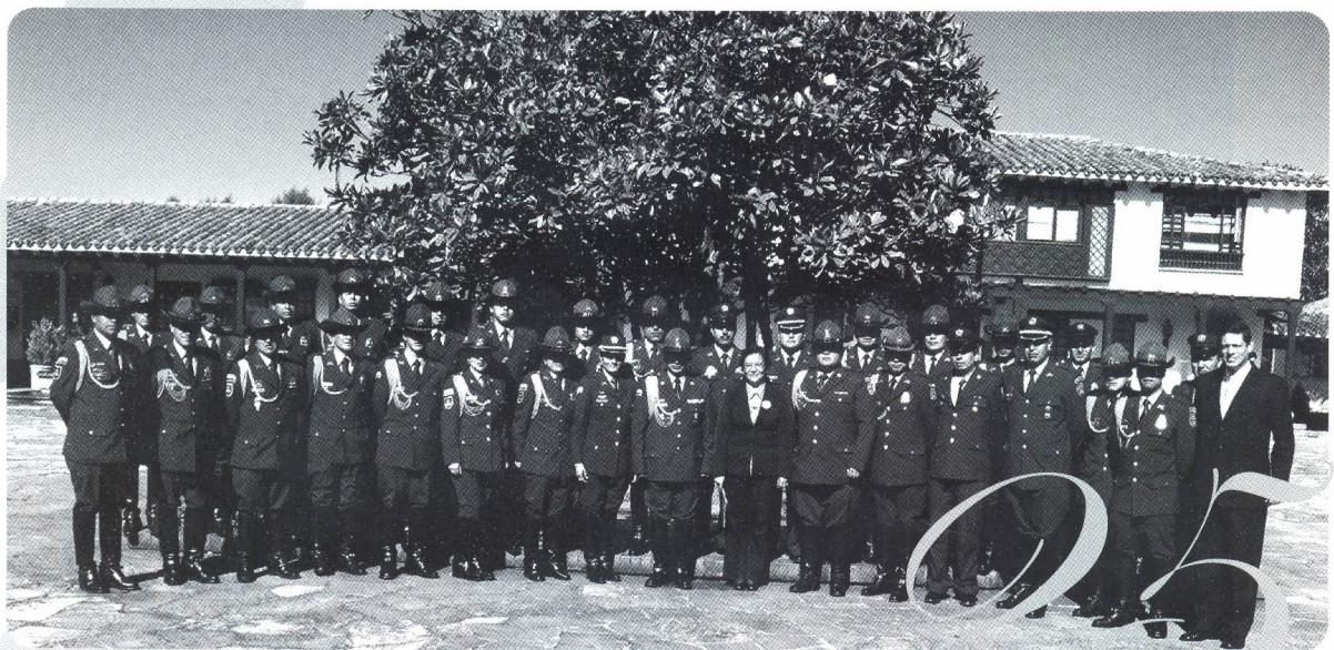
Diplomado en Formación Docente e Investigación Universitaria.

Por todo lo anterior, es motivo de orgullo para la Facultad hacer parte esencial de estas actividades cuya importancia trasciende en todos los aspectos académicos y educativos.