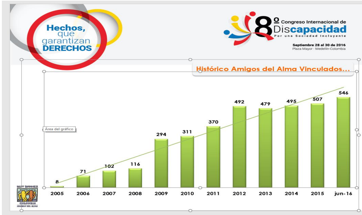
Gráfico: Cantidad de PcD vinculados en la última década