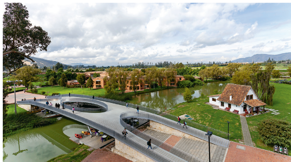
El comité tiene por objeto contribuir a la prevención y solución de las situaciones ocasionadas por conductas que puedan constituir acoso laboral.

El período de los miembros del comité será de dos años, a partir de la conformación de este, que se contarán desde la fecha de la comunicación de la elección o de la designación. Lo anterior sin perjuicio de