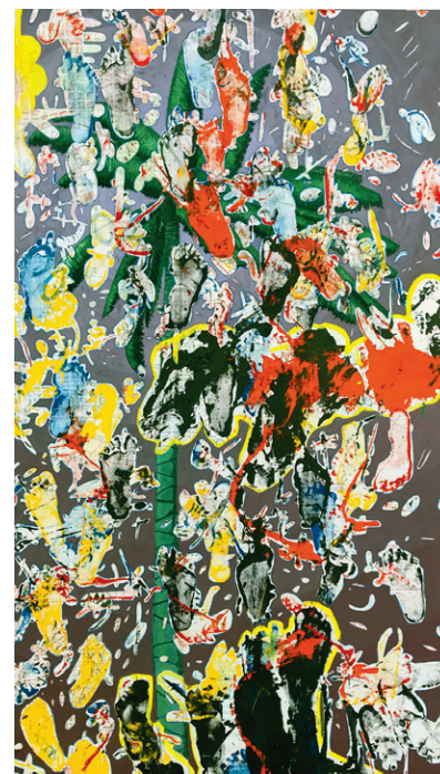
Morales Duque nos invita a revisar la urgencia de preservar las especies en vía de extinción.

El miércoles 10 de octubre, a las 11:00 a. m., el artista dialogará con los estudiantes, profesores y personal de la Universidad en torno a “FRAGIL real IDAD”.