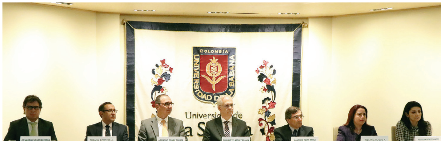
El aseguramiento de la calidad hace parte de los frentes estratégicos de nuestra Universidad. El reto es mantenernos siempre encaminados hacia la mejora continua.

Seguro de una continua y satisfactoria operación del SGC de la Universidad, el Icontec entrega esta certificación hasta noviembre del 2021, ratificando así el compromiso de nuestra Institución con la mejora permanente y el fortalecimiento de la cultura de la calidad, no solo desde el ámbito académico, sino desde los servicios que lo apoyan.