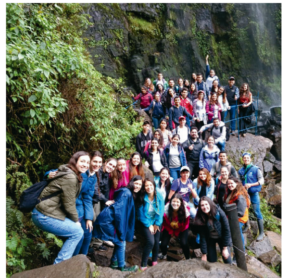
Estudiantes y profesores durante la caminata por la cascada La Chorrera en Choachí, Cundinamarca.

Antes de esta salida, los profesores y estudiantes realizaron un trabajo de investigación de dos semanas sobre la zona donde se realizó la caminata para obtener una aproximación a los ambientes naturales de este lugar y desarrollar habilidades en ciencias naturales.