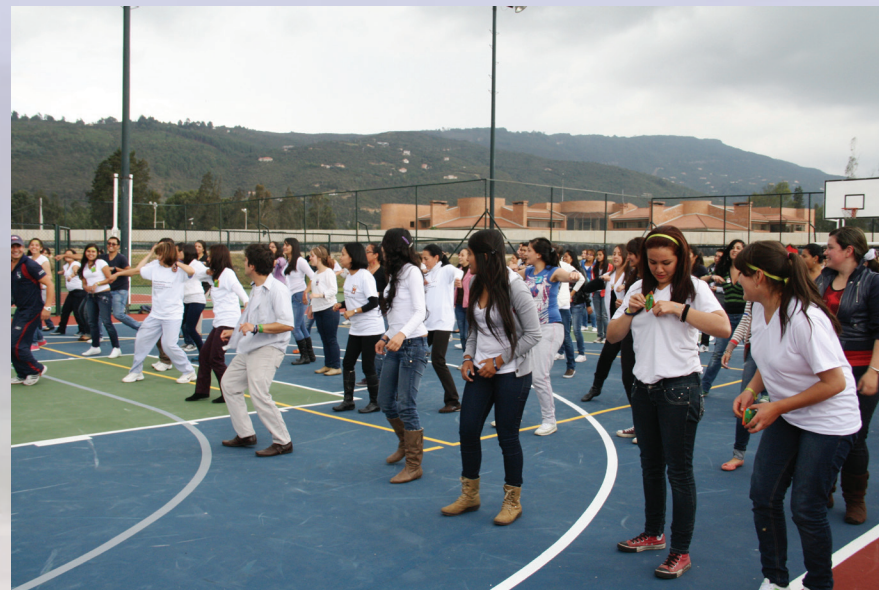
■ Grupo de profesores y estudiantes en Jornada de Integración.