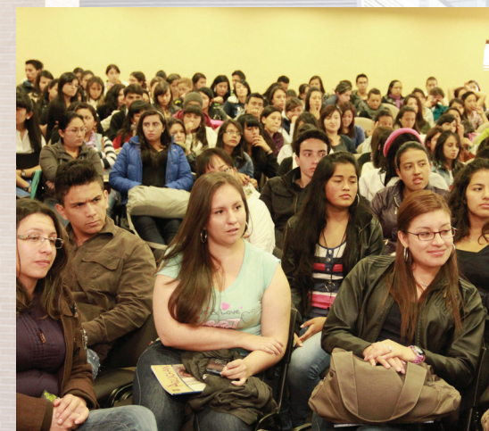
Estudiantes en actividades extracurriculares.